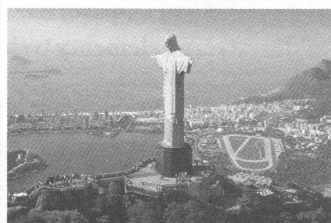
Rio de Janeiro

ĆWICZENIE 12. Dopasuj nazwę miasta do państwa, w którym się ono znajduje. W razie trudności poszukaj informacji w internecie.